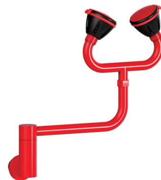
型号: KC 3-2

壁式双口洗眼器安装在实验操作台附近，常用于当发生化学液体或有毒物质溅到工作人员眼睛、脸或者身体时，将危害降到最低程度，减少有毒物质对工作人员的伤害。